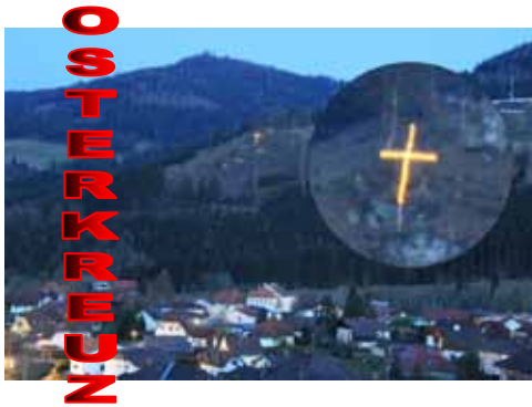
Das Osterkreuz leuchtete als Zeichen der Auferstehung weit über Straßburg.