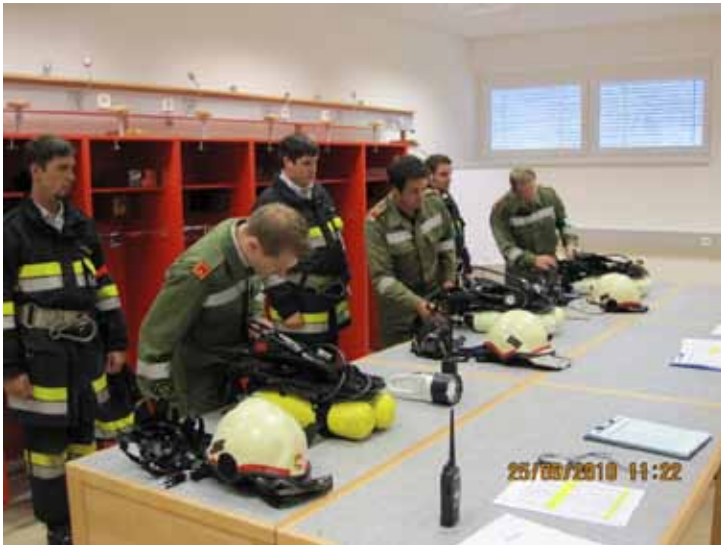
Die Ausrüstung wird begutachtet

Die Feuerwehr Straßburg verfügt zurzeit über 20 ausgebildete Atemschutzträger. 3 Kameraden besuchten den Atemschutzgeräteträgerkurs an der Landesfeuerwehrschule und 3 Kameraden absolvierten das Seminar "Atemschutz-Innenangriff".