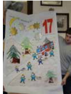
17. Fenster für den Straßburger Adventkalender von der Feuerwehrjugend.