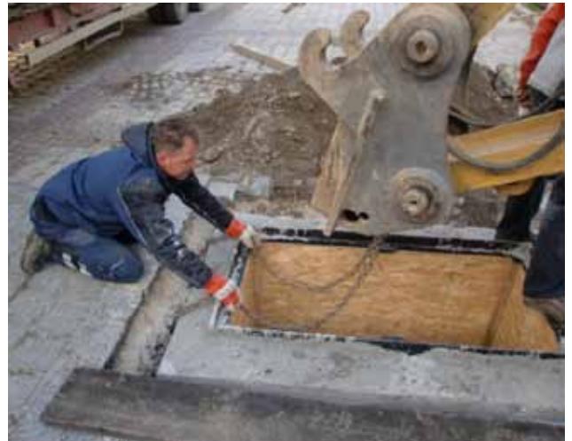
Der Kommandant ist immer dabei

Die Vorbereitungsarbeiten dafür sind vielfältig und bereits angelaufen. Als Voraussetzung für die Durchführung der Wettkämpfe wurde am Hauptplatz ein Wasserbezugsbecken errichtet. Im Rahmen der Landesmeisterschaft werden ca. 60 Feuerwehren aus Kärnten zum kameradschaftlichen Wettkampf antreten.